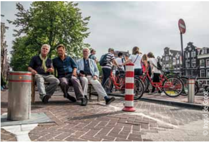
Buurtbewoners zijn blij met de paaltjes