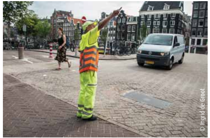
Komende tijd zullen verkeersregelaars aanwezig zijn op de plekken waar doorgaand verkeer niet meer mogelijk is