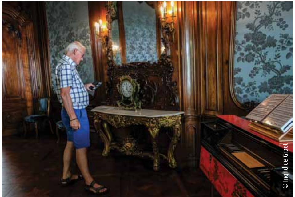
De zaal in het achterhuis

voorbereiding, verspreid over het land, die gezamenlijk 500 jaar ontwikkeling van het woonhuis zullen weergeven. Voor een boeiend bezoek kun je straks kiezen uit huizen van verschillende periodes, variërend van de 16e tot de 21ste eeuw.