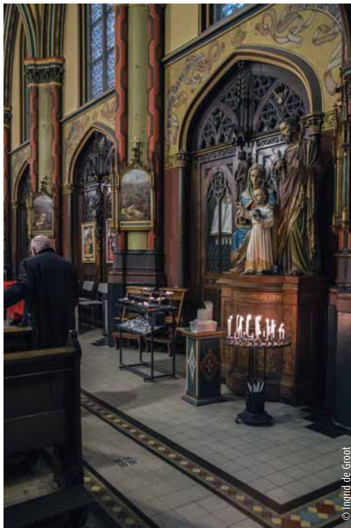
Interieur van de Onze Lieve Vrouwekerk aan de Keizersgracht