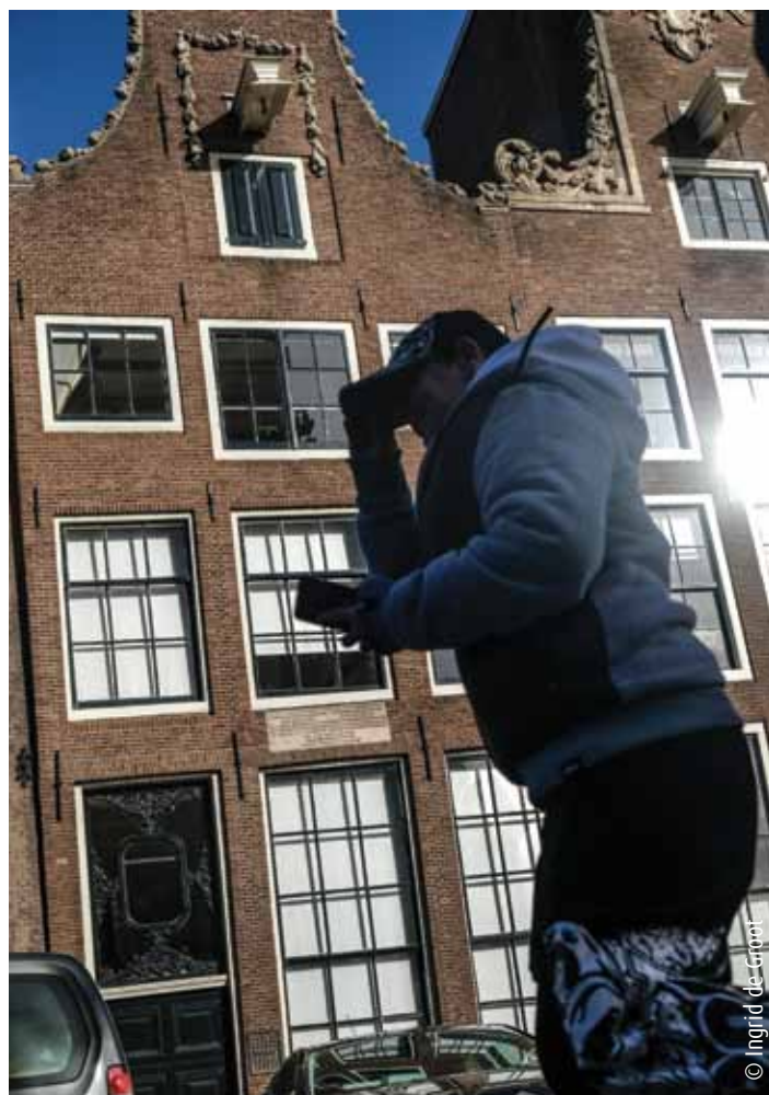
Woonhuis (met witte rolgordijnen) waar Descartes gedurende de zomer van 1634 heeft gewoond. Aldus de tekst op de plaquette.

Van Spinoza staan in Amsterdam twee standbeelden. Van Descartes rest de gevelsteen aan het huis van zijn grensoverschrijdend gedrag