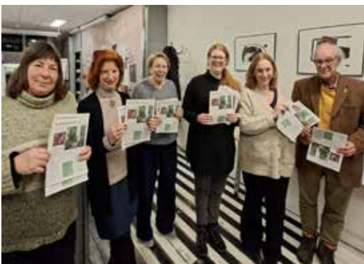
Deel van redactieteam