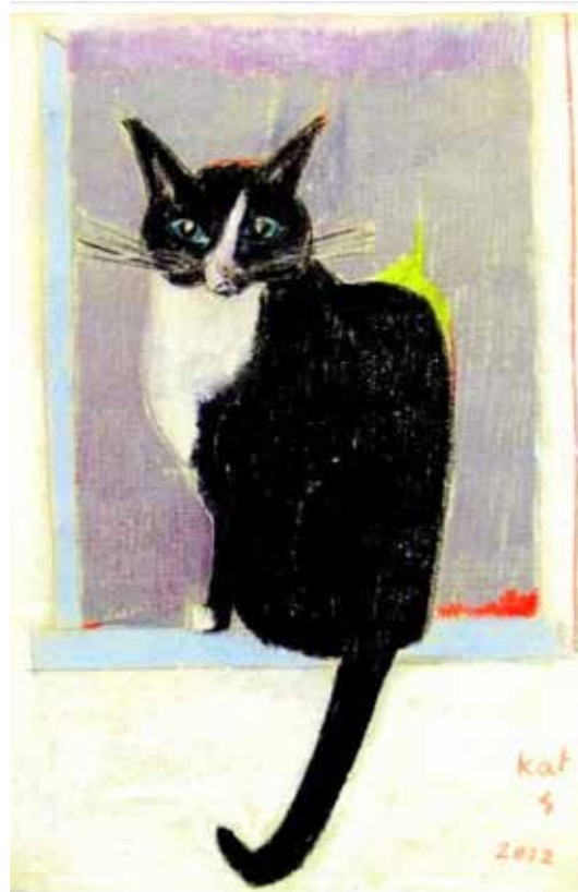
'Kika kijkt mee' tekening: Katelijne Davids